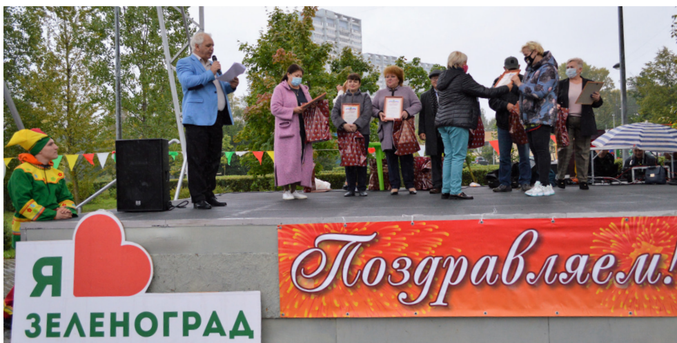
Награждение лучших силинцев