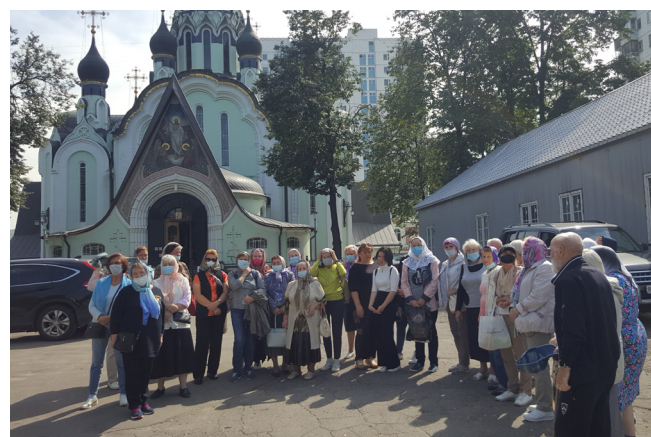
У храма Воскресения Христова в Сокольниках